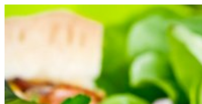
ATELIER DES SAVEURS